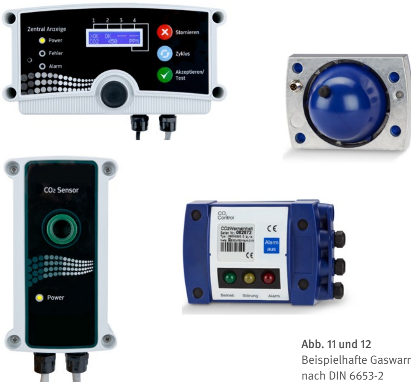
Abb. 11 und 12 Beispielhafte Gaswarnanlagen nach DIN 6653-2