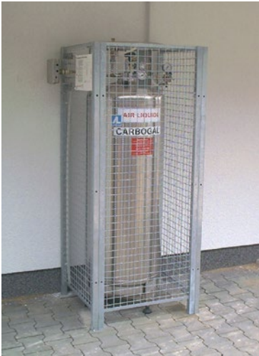
Abb. 5 Aufstellungsbeispiel für einen stationären Druckbehälter