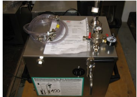
Abb. 9 Beispielhafte nicht verwendungsfertige Getränkeschankanlage

Maßnahmen zum Personenschutz erforderlich, zum Beispiel: