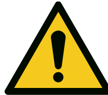
Abb. 7 Warnschilden W001 „Allgemeines Warnschild“