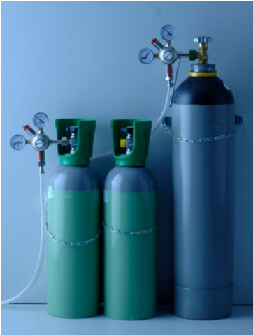
Abb. 3 Entleeren und Bereithalten von Druckgasflaschen

Abweichend von Abschnitt 5.2.2.2 dürfen in Räumen unter Erdgleiche, die eine Grundfläche \leq 12 \text{ m}^2 haben und die allseitig mit festen öffnungslosen Wänden von mehr als 1,5 m Höhe umgeben sind, bis zu zwei Druckgasflaschen mit einem maximalen Fassungsvermögen von je 14 l bzw. 10 kg Füllgewicht zum Entleeren angeschlossen werden.