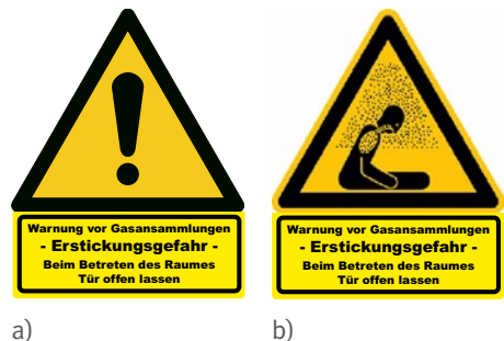
Abb. 1 Warnzeichen: a) W001 „Allgemeines Warnzeichen“ b) W041 „Warnung vor Erstickungsgefahr“ mit Zusatzschild „Warnung vor Gasansammlungen – Erstickungsgefahr“

An den Zugängen zu allen Räumen, in denen eine Gefährdung durch ausströmende Schankgase entstehen kann, sind Warnzeichen gemäß Abbildung 1a oder 1b deutlich sichtbar und dauerhaft anzubringen. Hinsichtlich der Größe und Kennzeichnung siehe Technische Regeln für Arbeitsstätten „Sicherheits- und Gesundheitsschutzkennzeichnung“ (ASR A1.3).