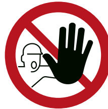
Abb. 6 Verbotsschilden D-P006 „Zutritt für Unbefugte verboten“