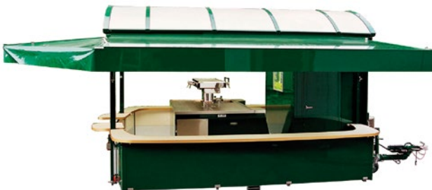
Abb. 10 Beispiel eines Ausschankwagens mit begehbarem Kühlraum und integrierter Getränkeschankanlage