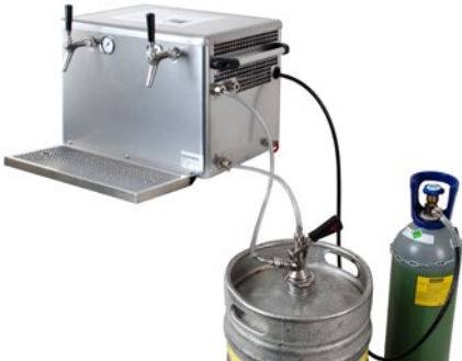
Abb. 8 Beispielhafte verwendungsfertige Getränkeschankanlage