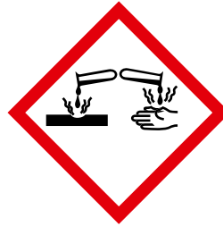
Abb. 14 Kennzeichnung eines Stoffes mit Ätzwirkung

Für Reinigung und Desinfektion sind nur Produkte zu verwenden, für die der Hersteller bescheinigt hat, dass sie dem Stand der Technik entsprechen und unter Berücksichtigung der Getränkeart für die zu reinigenden Bauteile geeignet sind.