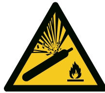
Abb. 2 Warnzeichen W029 „Warnung vor Gasflaschen“

Aufstellungsräume für zum Entleeren angeschlossene Druckgasflaschen sind